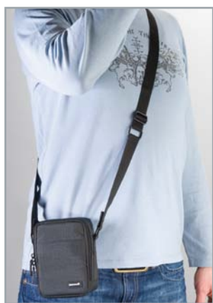
Bequemes Tragen ermöglicht der verstellbare Schultergurt The adjustable shoulder strap makes it comfortable to carry