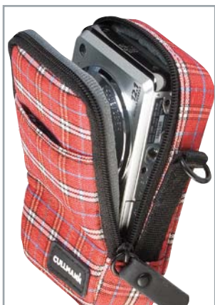
Einen schnellen Zugriff garantiert die große Taschenöffnung The large bag opening provides fast access