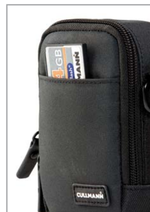
Platz für Speicherkarten bietet die zusätzliche Außentasche The additional outside pocket provides space for the memory card

Alle Maße und Gewichtsangaben sind Circa-Werte. Design-Änderungen und Farbabweichungen zu den Abbildungen sind möglich. Technische Änderungen sowie Irrtum vorbehalten.