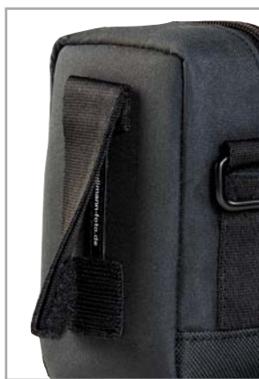
Sichere und schnelle Gürtelbefestigung dank bewährtem Q+S System A secure and fast securing of the strap thanks to the tried and tested Q+S system