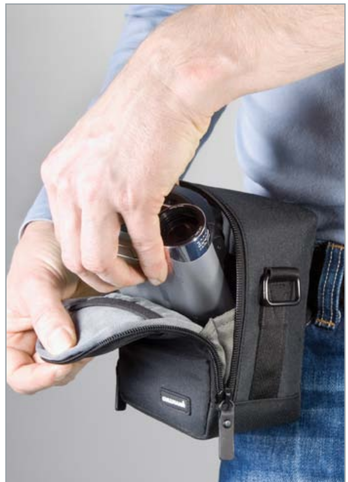
BERLIN Vario 200 [95850] black

red check brown check blue check grey check black