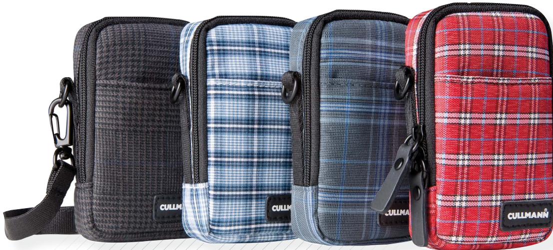
BERLIN Compact 100 [95813] brown check