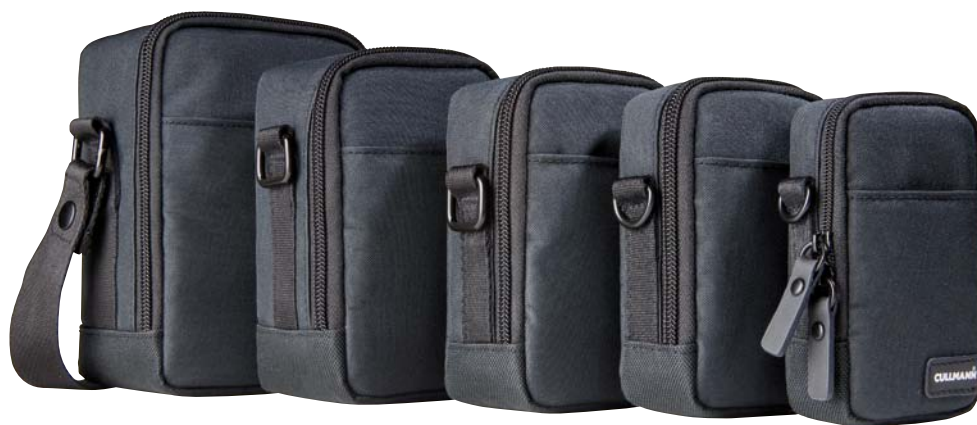
BERLIN Vario 200 [95850] black BERLIN Vario 100 [95840] black BERLIN Compact 300 [95830] black BERLIN Compact 200 [95820] black BERLIN Compact 100 [95810] black